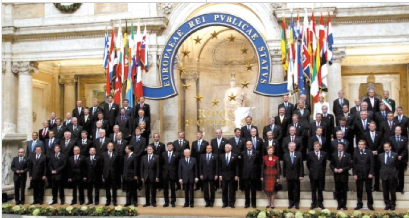
Firma del Tratado Constitucional en Roma, el 29 de octubre de 2004.

de las instituciones, que logró realizar un proyecto de Tratado Constitucional y tras un proceso de debate y reforma finalmente se consiguió la aprobación del Tratado Constitucional de la Unión Europea elaborado por la Convención y reformado por la Conferencia Intergubernamental, celebrándose por los 25 Estados de la Unión el acto simbólico de la firma, en Roma, de la Constitución Europea el 29 de octubre de 2004 , quedando esta fecha marcada para siempre en la historia.