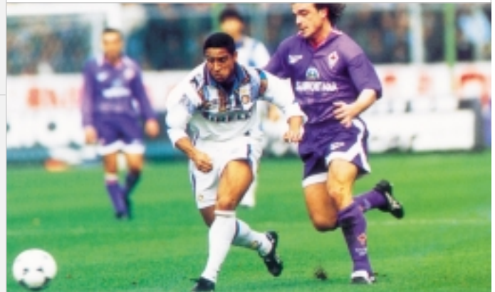
Entre las cuatro libertades, la libertad de circulación de las personas, también en los deportes.

La consagración de la personalidad jurídica de la Unión, es una de las novedades principales de la Constitución Europea. Hasta entonces la Unión Europea no disponía de personalidad jurídica expresa, en tanto que la Comunidad Europea incluida en la Unión Europea sí era sujeto de Derecho Internacional. De este modo se refuerza la identidad europea otorgando una mayor claridad del sistema jurídico Europeo para los ciudadanos y permitiendo la creación de un Tratado Constitucional único que es la llamada Constitución Europea.